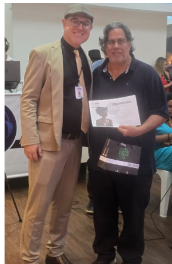
Granja News recebendo certificado de participação

A cobertura jornalística e o apoio institucional do Granja News foram celebrados oficialmente. Durante o evento, a equipe do jornal recebeu um Certificado de Participação das mãos do Secretário de Trabalho e Renda, Dr. Michel Silva Alves. A homenagem reconheceu o papel do veículo na divulgação e fortalecimento das iniciativas que movem a economia da cidade. Fugindo do padrão estético excludente de grandes eventos de moda, o Co-