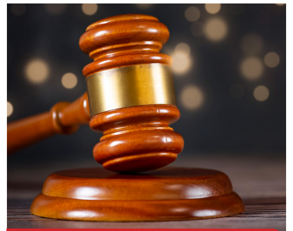
Despejo por falta de pagamento