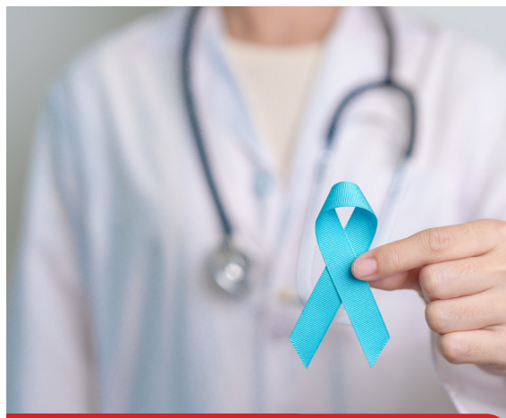
Saiba mais sobre o câncer de próstata