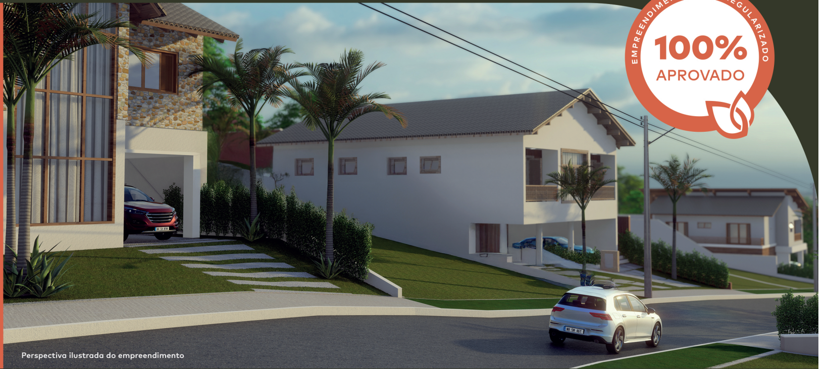
Perspectiva ilustrada do empreendimento