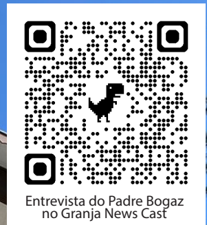
Entrevista do Padre Bogaz no Granja News Cast