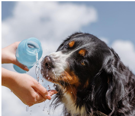
Prefeitura de Cotia promove Caravana da Saúde Animal